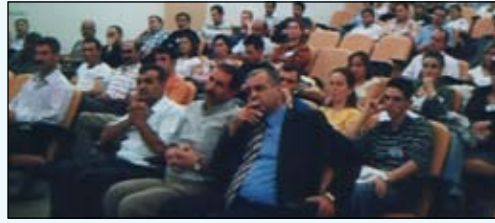
İzmir Şube Genel Kurul salonundan bir köşe