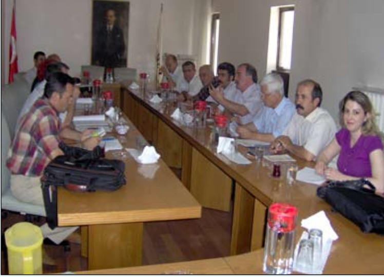
Sendikamız ile DMO ve KAMU-İŞ yetkilileri TİS görüşmesinde

Bu nedenle Ç.S.G.B. Ankara Bölge Müdürlüğü'nce resen başvurulması üzerine görüşmelere İş Mahkemesince Resmi Arabulucu atandı. Resmi Arabulucu'nun çağrısı üzerine 11 Temmuz'da gerçekleşen toplantıda TİS önerimizin 28. maddesi hariç tamamı üzerinde anlaşma sağlandı. 28. "FAZLA ÇALIŞMA ve ÜCRETİ" maddesinde mevcut durumdan geri adım atmamızı isteyen işveren teklifinin, üyelerimiz arasında eşitsizliğe neden olacağından kabul edilememesi nedeniyle anlaşmazlık bu noktada devam etmektedir. Ücret ve diğer parasal konularda Hükümet Protokolü çerçevesinde herhangi bir sorun bulunmamaktadır. Bu durumda tek anlaşmazlık maddesi olan 28. madde üzerindeki işverenin geri adım atırma ısrarı kalktığı takdirde TİS görüşmelerinin anlaşma ile sonuçlanacağı umudumuz devam etmektedir.