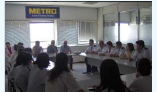
Metro İzmir toplantısı

29 Mayıs'ta Bodrum Mağazası işyerinde ya-