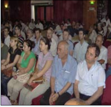
Temsilcilerimiz DİSK'in düzenlediği panelde

K onfederasyonumuz DİSK bu yıl 15-16 Haziran'ı anma çerçevesinde İstanbul Mecidiyeköy Kültür Merkezi'nde "37.Yılında 15-16 Haziran" gündemli İstanbul Bölge Temsilciler Kurulu toplantısı düzenledi. Toplantıda DİSK Genel Sekreteri Musa Çam bir sunuş yaptı. 1 Mayıs 2007'nin anlatıldığı kısa bir film gösteriminden sonra DİSK Genel Başkanı Süleyman Çelebi açış konuşmasını yaptı. Çelebi konuşmasında DİSK'in