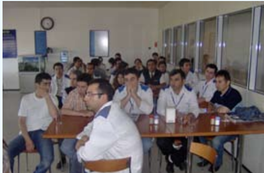
Metro B.Çekmece ve Bursa toplantıları

19 Haziran'da Gaziantep mağazasında gerçekleştirilen TİS bilgilendirme toplantı-