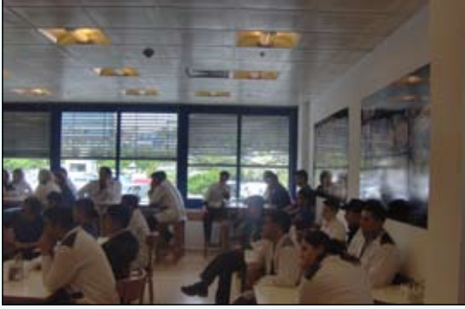
Metro Güneşli'deki toplantıdan görüntüler