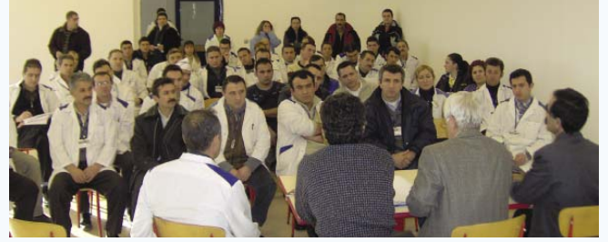
Ankara'da yapılan toplantıdan

Metro Grosmarketlerde 5 Aralık 2006 günü başlayan Toplu İş Sözleşmesi görüşmeleri gerek 60 günlük sürenin dolmuş olması, gerekse mevcut durumdan geri düzenlemeler içeren işveren önerileri nedeniyle tıkanı.