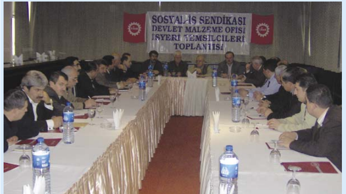
DMO taslak hazırlık toplantısı

Çalışmalar sonunda ortaya çıkan ortak görüşler TİS önerisi olarak işverenliğe sunulacak. TİS görüşmeleri için gerekli olan "Yetki Belgesi" gazetemizin yayına hazırlandığı son gün elimize ulaştı.