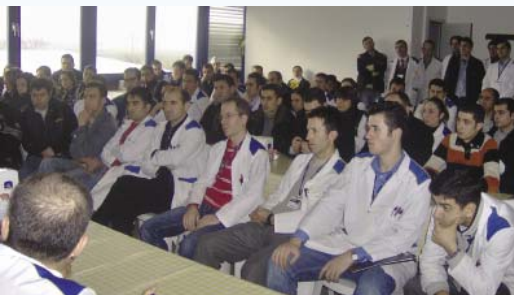
Bursa'da yapılan toplantı

Resmi Arabulucu'nun önümüzdeki günlerde görevi tebliğ ederek çalışmalarına başlaması bekleniyor.