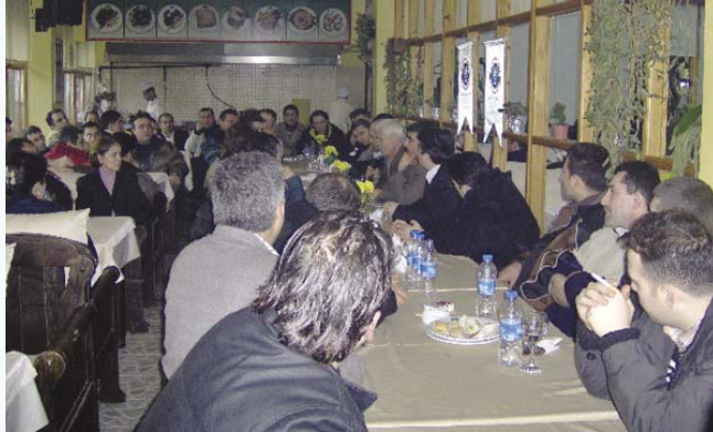
Güneşli-B. Çekmece ortak toplantısı

Güneşli, Büyükkçekmece Mağazaları için ortak düzenlenen toplantı 18 Ocak günü Plevne Par-