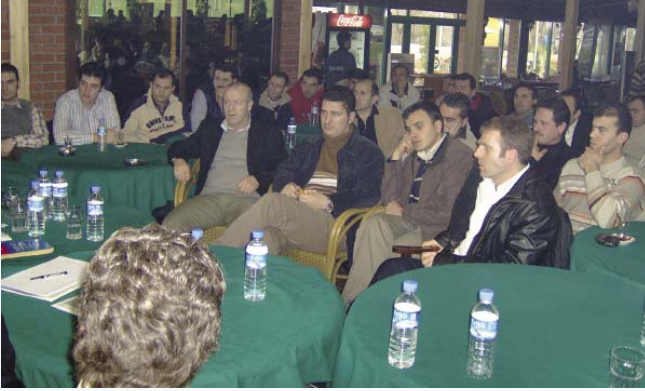
Bursa toplantısından bir görüntü

Metro Grosmarketler ile yapılan toplu iş sözleşmeleri görüşmeleri hakkında hem üyelerimizi bilgilendirmek, hem de onların bu konuda düşüncelerini öğrenmek, görüşlerini almak için iki tur toplantılar düzenlendi.